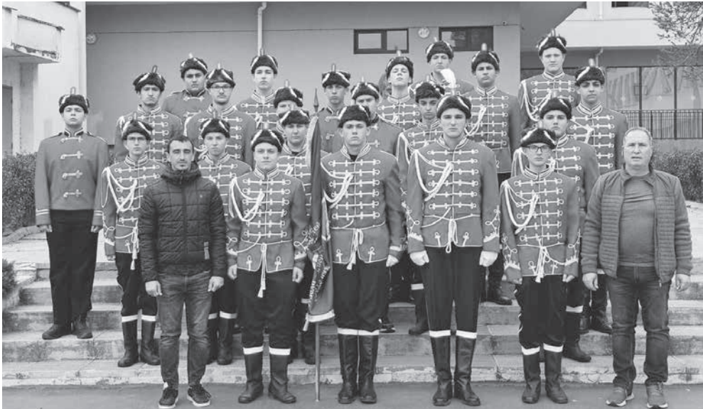
Момчетата показват страхотна дисциплина

Ритуали и принципи. Момчетата вярват, че са част от отряд-символ на българската държава