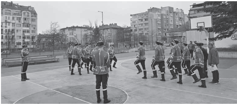
Гвардейците на Електро поддържат форма с чести марширувания в двора на училището